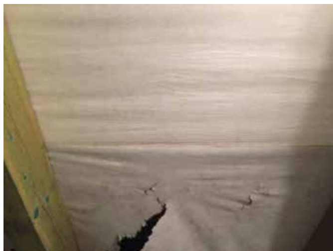
Obrázky: dole: 3vrstvá mikroporézní fólie 135 g/m 2 , nahoře: Tyvek®