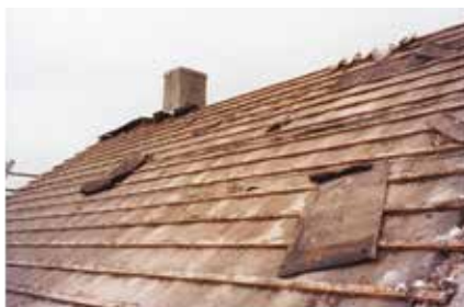
Zborcení konstrukce budovy působením hub a plísní