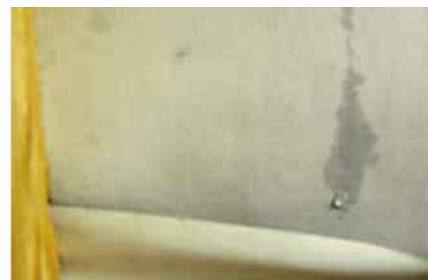
Poškození stěn v interiéru po vniknutí vody